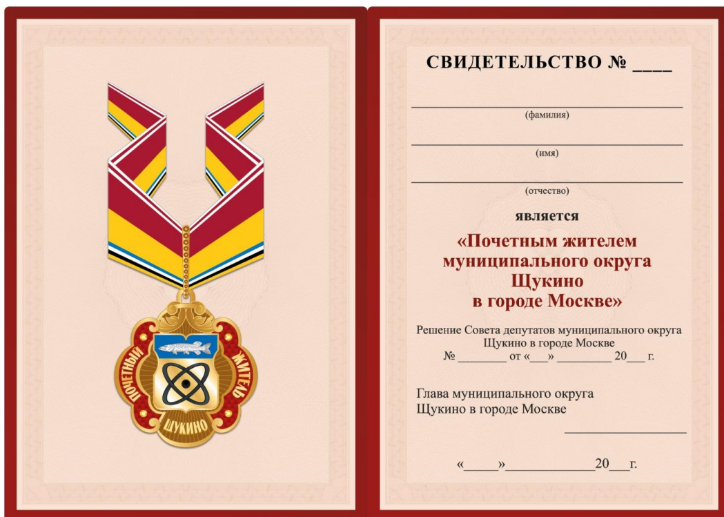
Внутренняя сторона Размер свидетельства 210×150 мм