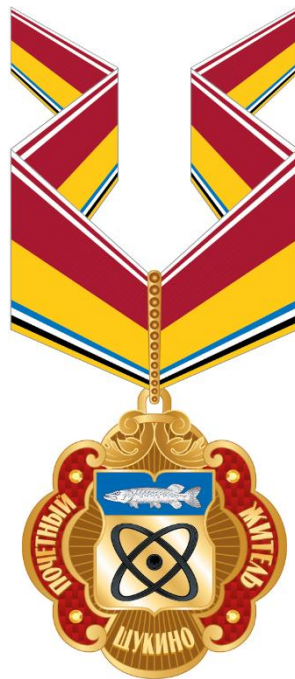
Рисунок знака к почетному званию муниципального округа Щукино в городе Москве "Почетный житель муниципального округа Щукино в городе Москве" (на шейной ленте)

Приложение 4 к решению Совета депутатов муниципального округа Щукино в городе Москве от «15» февраля 2024 года № 35-05