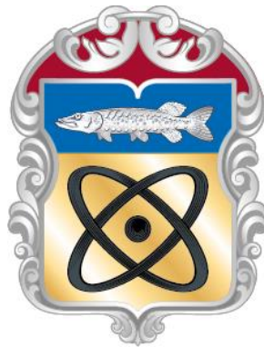
Рисунок нагрудного знака к Благодарности муниципального округа Щукино в городе Москве

Приложение 13 к решению Совета депутатов муниципального округа Щукино в городе Москве от «15» февраля 2024 года № 35-05