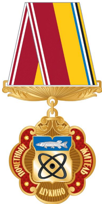
Рисунок ленты знака к почетному званию муниципального округа Щукино в городе Москве "Почетный житель муниципального округа Щукино в городе Москве" в виде розетки

Рисунок знака к почетному званию муниципального округа Щукино в городе Москве "Почетный житель муниципального округа Щукино в городе Москве" (на трапециевидной колодке)