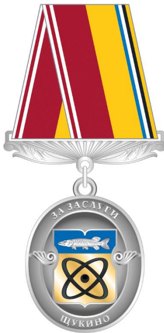
Рисунок знака отличия муниципального округа Щукино в городе Москве "За заслуги"

Приложение 7 к решению Совета депутатов муниципального округа Щукино в городе Москве от «15» февраля 2024 года № 35-05