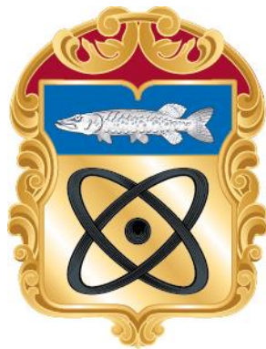
Рисунок нагрудного знака к Почетной грамоте муниципального округа Щукино в городе Москве

Приложение 10 к решению Совета депутатов муниципального округа Щукино в городе Москве от «15» февраля 2024 года № 35-05