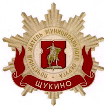
Рисунок нагрудного знака к званию «Почетный житель внутригородского муниципального образования – муниципального округа Щукино в городе Москве»

Приложение 3 к решению Совета депутатов внутригородского муниципального образования – муниципального округа Щукино в городе Москве от 20 февраля 2025 года № 46-05