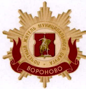
Рисунок нагрудного знака к званию «Почетный житель внутригородского муниципального образования – муниципального округа Вороново в городе Москве»

Приложение 3 к решению Совета депутатов внутригородского муниципального образования – муниципального округа Вороново в городе Москве от «19» февраля 2025 года № 02/02