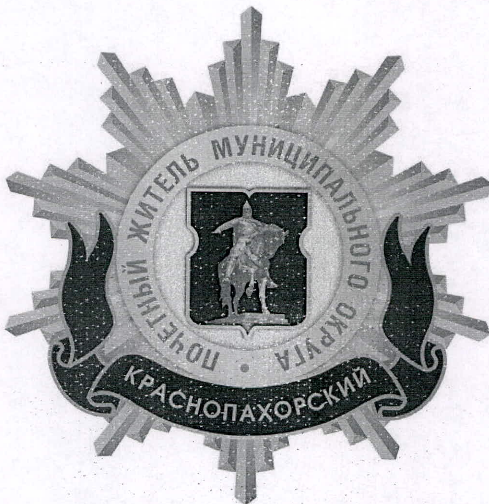
Рисунок нагрудного знака к званию «Почетный житель внутригородского муниципального образования – муниципального округа Краснопахорский в городе Москве»

Приложение 3 к решению Совета депутатов внутригородского муниципального образования – муниципального округа Краснопахорский в городе Москве от 20.02.2025 № 3/3