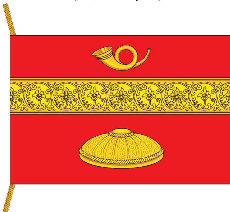
РИСУНОК ФЛАГА МУНИЦИПАЛЬНОГО ОКРУГА БАСМАНЫЙ В ГОРОДЕ МОСКВЕ (лицевая сторона)

Приложение к Положению «О флаге муниципального округа Басманный в городе Москве»