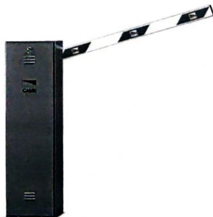
Рис. 3. Внешний вид шлагбаума

Шлагбаум (см. рисунок) состоит из алюминиевой стрелы белого цвета с зеркальными отражательными поперечными полосками красного и белого цвета, а также стальной стойки, обработанной катафорезом и покрашенной полиэфирной краской в оранжевый цвет. Стойка шлагбаума может быть снабжена сигнальной лампой желтого цвета для предупреждения водителей транспортных средств и пешеходов, об опускании (поднятии) стрелы шлагбаума.