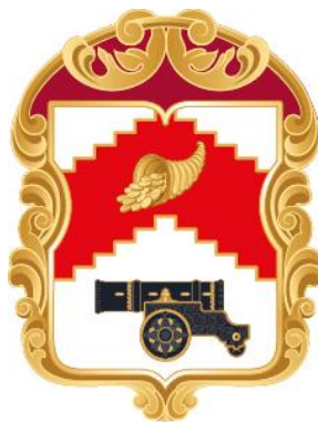
Рисунок нагрудного знака к Почетной грамоте муниципального округа Мещанский

Приложение 10 к решению Совета депутатов муниципального округа Мещанский от 08 февраля 2024 г. № Р-18