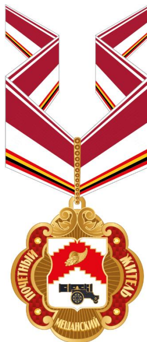
Рисунок знака к почетному званию муниципального округа Мещанский "Почетный житель муниципального округа Мещанский" (на шейной ленте)

Приложение 4 к решению Совета депутатов муниципального округа Мещанский от 08 февраля 2024 г. № Р-18