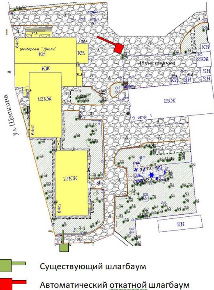
Рис. 1 Схема размещения ограждающих конструкций

1.1. Место размещения шлагбаума: г. Москва, ул. Щепкина, д. 64 стр. 2, при въезде на придомовую территорию д.64 стр. 2 и д. 64 стр. 1.