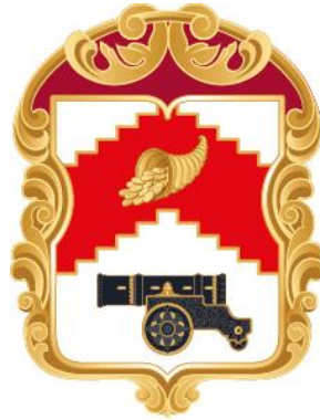
Рисунок нагрудного знака к Почетной грамоте муниципального округа Мещанский в городе Москве

Приложение 10 к решению Совета депутатов муниципального округа Мещанский в городе Москве от 11 апреля 2024 года № Р-45