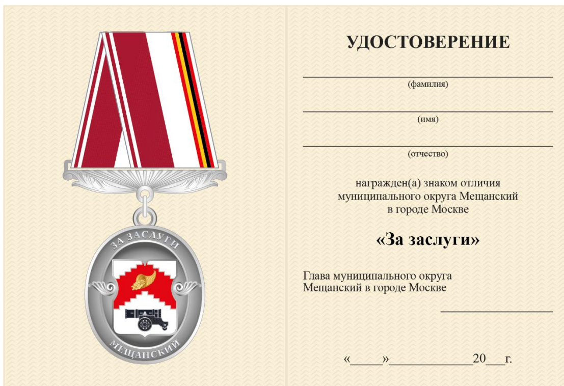
Внутренняя сторона Размер удостоверения 145×105 мм