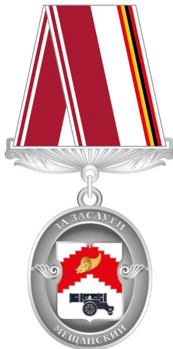
Рисунок знака отличия муниципального округа Мещанский в городе Москве "За заслуги"

Приложение 7 к решению Совета депутатов муниципального округа Мещанский в городе Москве от 11 апреля 2024 года № Р-45