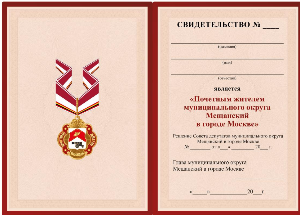
Внутренняя сторона Размер свидетельства 210×150 мм