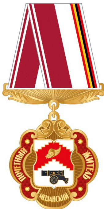
Рисунок ленты знака к почетному званию муниципального округа Мещанский в городе Москве "Почетный житель муниципального округа Мещанский в городе Москве" в виде розетки