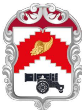
Рисунок нагрудного знака к Благодарности муниципального округа Мещанский в городе Москве

Приложение 13 к решению Совета депутатов муниципального округа Мещанский в городе Москве от 11 апреля 2024 года № Р-45