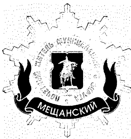
Рисунок нагрудного знака к званию «Почетный житель внутригородского муниципального образования – муниципального округа Мещанский в городе Москве»

Приложение 3 к решению Совета депутатов внутригородского муниципального образования – муниципального округа Мещанский в городе Москве от 17 февраля 2025 года № Р-24