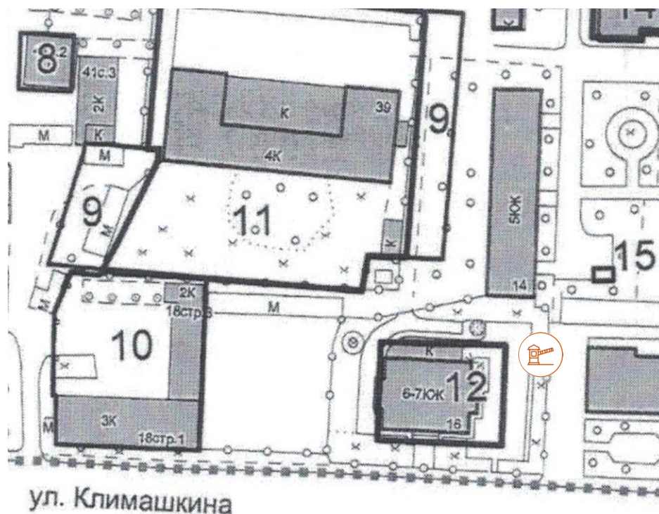
Схема установки ограждения (1-го шлагбаума) на территории муниципального округа Пресненский по адресу: Климашкина ул., д. 16

к решению Совета депутатов муниципального округа Пресненский от 08.11.2023 № 18.09.207