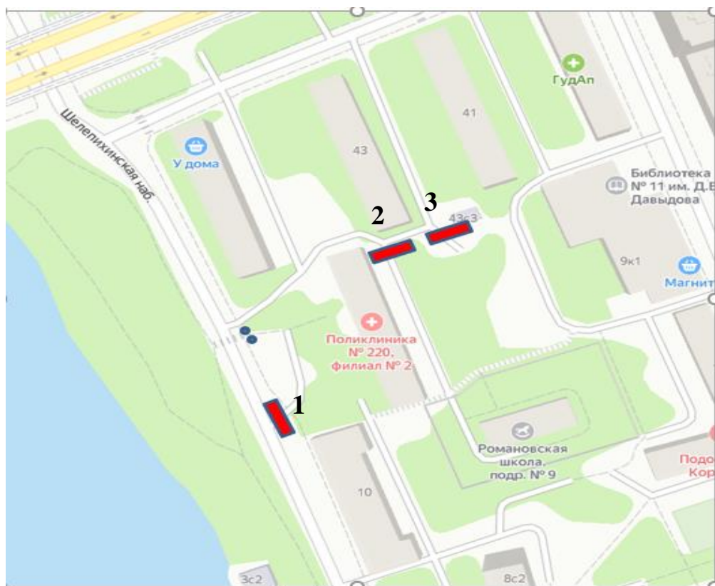
Рис. 1. Схема размещения шлагбаумов

установки ограждающих устройств (3-х шлагбаумов) на придомовой территории в муниципальном округе Пресненский по адресу: Шелепихинская наб., д.12