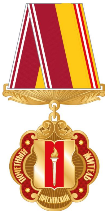
Рисунок ленты знака к почетному званию муниципального округа Пресненский в городе Москве "Почетный житель муниципального округа Пресненский в городе Москве" в виде розетки

Рисунок знака к почетному званию муниципального округа Пресненский в городе Москве "Почетный житель муниципального округа Пресненский в городе Москве" (на трапециевидной колодке)