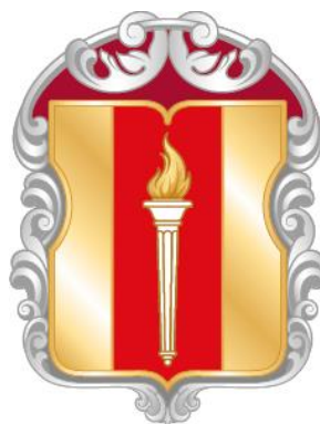
Рисунок нагрудного знака к Благодарности муниципального округа Пресненский в городе Москве