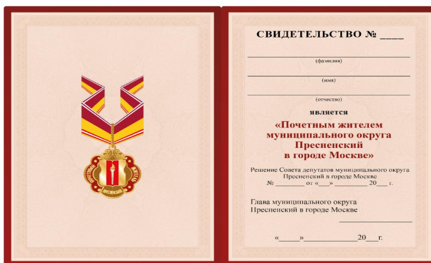
Внутренняя сторона Размер свидетельства 210×150 мм