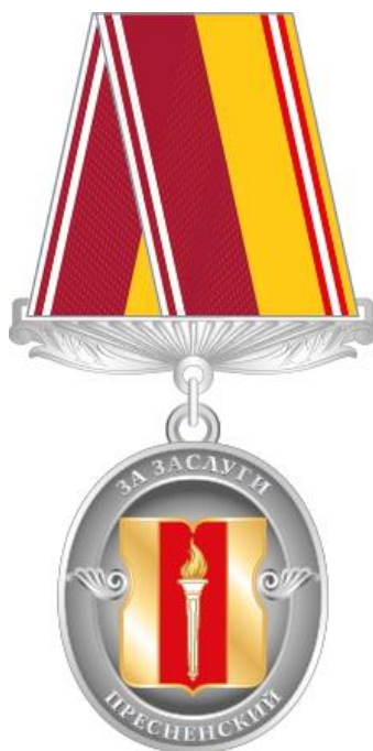
Рисунок знака отличия муниципального округа Пресненский в городе Москве "За заслуги"