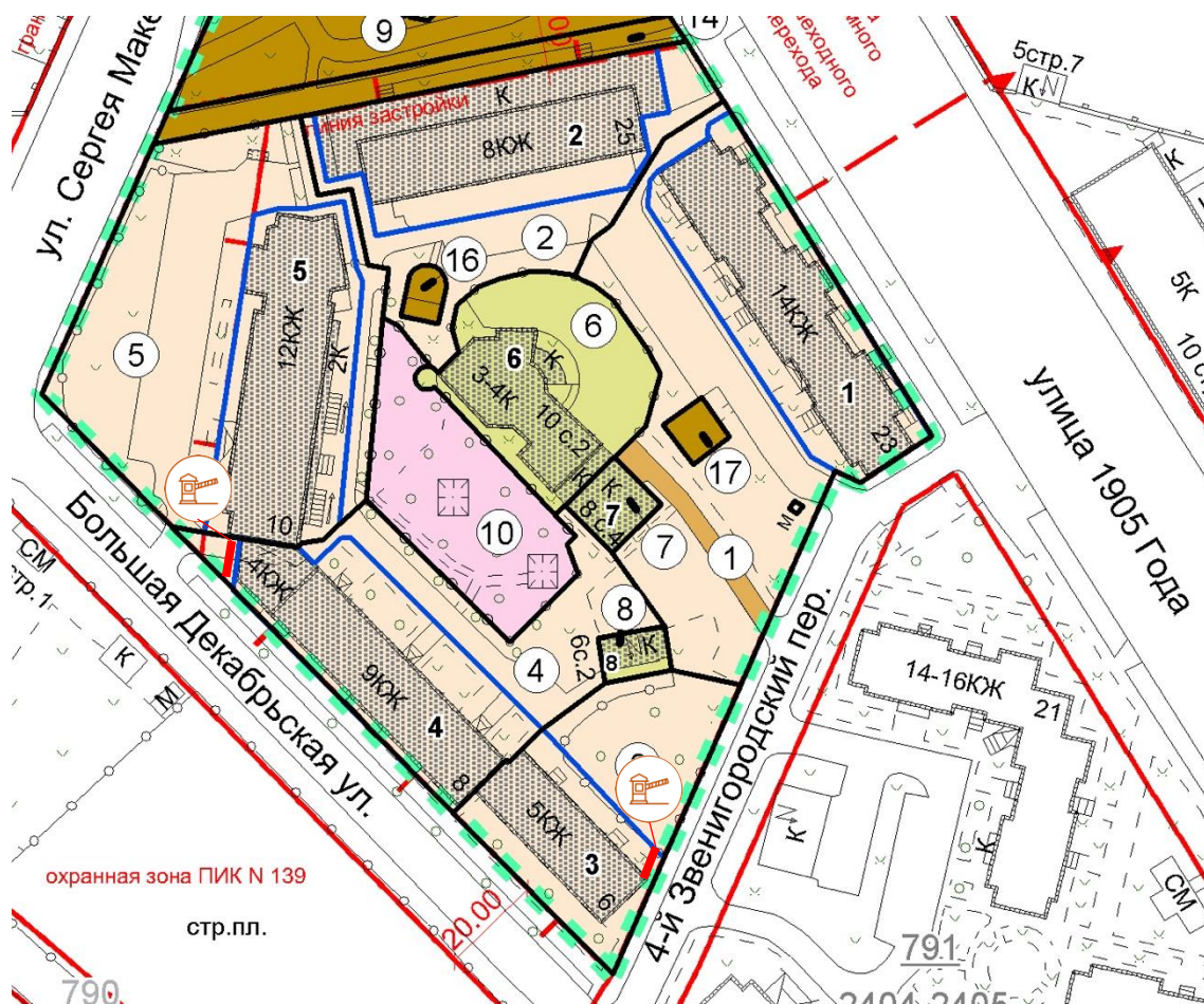
Схема установки ограждающих устройств (2 шлагбаумов) на территории муниципального округа Пресненский по адресу: Декабрьская Б. ул., д.6, д.8

к решению Совета депутатов муниципального округа Пресненский от 16.08.2023 № 14.01.171