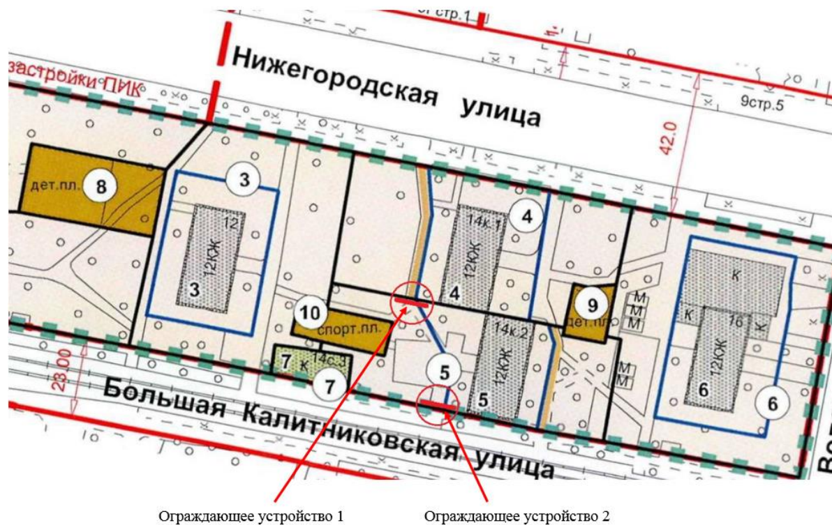
Схема установки ограждающих устройств по адресу: г. Москва, ул. Нижегородская, д. 14, корп. 2

Приложение к решению Совета депутатов муниципального округа Таганский от 15 августа 2023 года № 7-1/16