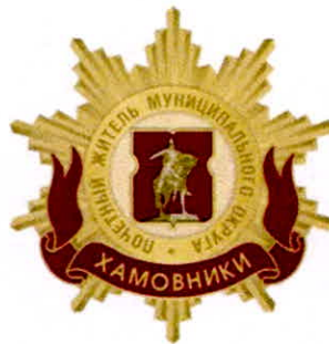
Рисунок нагрудного знака к званию «Почетный житель внутригородского муниципального образования – муниципального округа Хамовники в городе Москве»

Приложение 3 к решению Совета депутатов внутригородского муниципального образования – муниципального округа Хамовники в городе Москве от 20 февраля 2025 года № 4/5