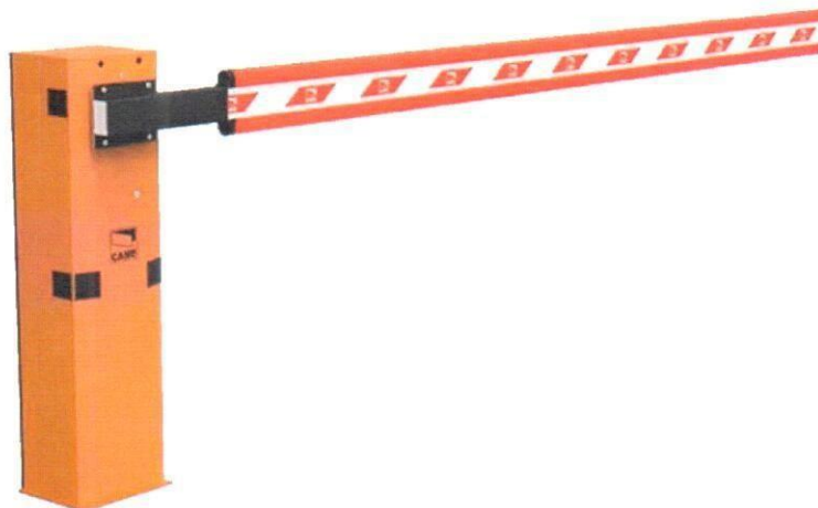
Рис. 3 Внешний вид шлагбаума

1.4. Внешний вид шлагбаума: Стойка шлагбаума снабжена светоотражающей арматурой для видимости в темное время суток. Яркая раскраска шлагбаума делает его заметным для пешеходов.