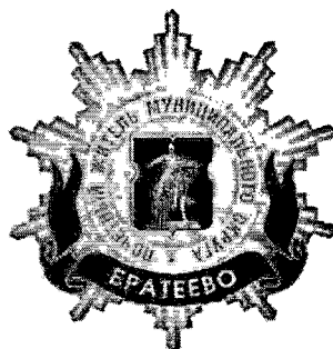
Рисунок нагрудного знака к званию «Почетный житель внутригородского муниципального образования – муниципального округа Братеево в городе Москве»

Приложение 3 к решению Совета депутатов внутригородского муниципального образования - муниципального округа Братеево в городе Москве от «18» 02 2025 № МБР-01-03-04/25