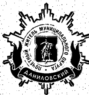
Рисунок нагрудного знака к званию «Почетный житель внутригородского муниципального образования – муниципального округа Даниловский в городе Москве»

Приложение 3 к решению Совета депутатов внутригородского муниципального образования – муниципального округа Даниловский в городе Москве от 18 февраля 2025 года № МДА-01-03-11