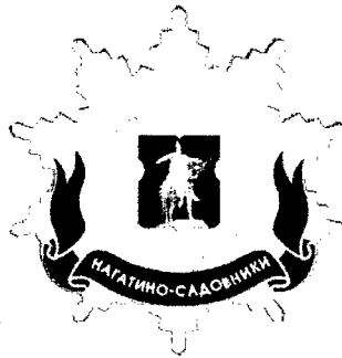
Рисунок нагрудного знака к званию «Почетный житель внутригородского муниципального образования – муниципального округа Нагатино- Садовники в городе Москве»

Приложение 3 к решению Совета депутатов внутригородского муниципального образования – муниципального округа Нагатино-Садовники в городе Москве от 18 февраля 2025 года № МНС-01-03-16