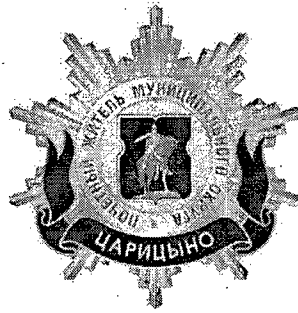
Рисунок нагрудного знака к званию «Почетный житель внутригородского муниципального образования – муниципального округа Царицыно в городе Москве»

Приложение 3 к решению Совета депутатов внутригородского муниципального образования – муниципального округа Царицыно в городе Москве от 19 февраля 2025 года №ЦА-01-05-02/01