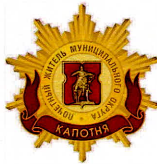
Рисунок нагрудного знака к званию «Почетный житель внутригородского муниципального образования – муниципального округа Капотня в городе Москве»

Приложение 3 к решению Совета депутатов внутригородского муниципального образования – муниципального округа Капотня в городе Москве от 20 февраля 2025 года № 36/1