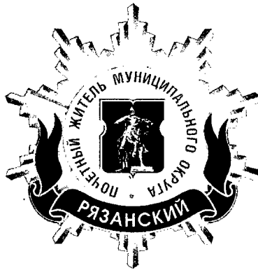
Рисунок нагрудного знака к званию «Почетный житель внутригородского муниципального образования – муниципального округа Рязанский в городе Москве»

Приложение 3 к решению Совета депутатов внутригородского муниципального образования – муниципального округа Рязанский в городе Москве от 18.02.2025 года № 48/1