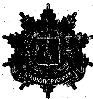
Рисунок нагрудного знака к званию «Почетный житель внутригородского муниципального образования – муниципального округа Южнопортовый в городе Москве»

Приложение 3 к решению Совета депутатов внутригородского муниципального образования – муниципального округа Южнопортовый в городе Москве от 18 февраля 2025 года № 3/1