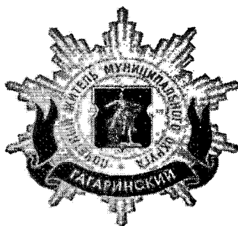
Рисунок нагрудного знака к званию «Почетный житель внутригородского муниципального образования – муниципального округа Гагаринский в городе Москве»

Приложение 3 к решению Совета депутатов муниципального округа Гагаринский в городе Москве от 19.02.2025 года № 45/5