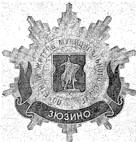
Рисунок нагрудного знака к званию «Почетный житель внутригородского муниципального образования – муниципального округа Зюзино в городе Москве»

Приложение 3 к решению Совета депутатов внутригородского муниципального образования – муниципального округа Зюзино в городе Москве от 14.02.2025 года №04/01-РСД