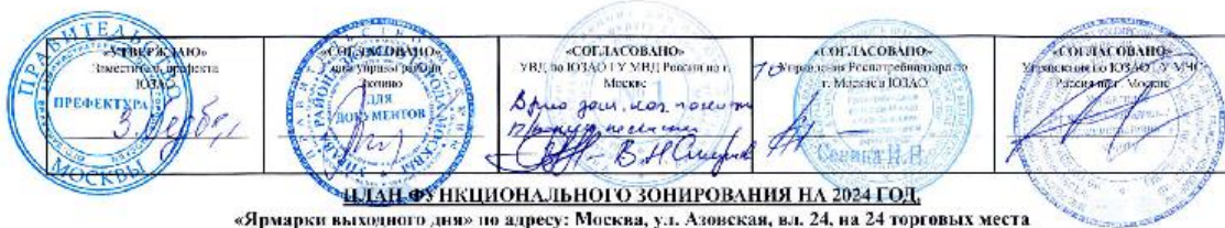
ПЛАН ФУНКЦИОНАЛЬНОГО ЗОНИРОВАНИЯ НА 2024 ГОД «Ярмарки выходного дня» по адресу: Москва, ул. Азовская, вл. 24, на 24 торговых места Режим работы: пятница, суббота, воскресенье