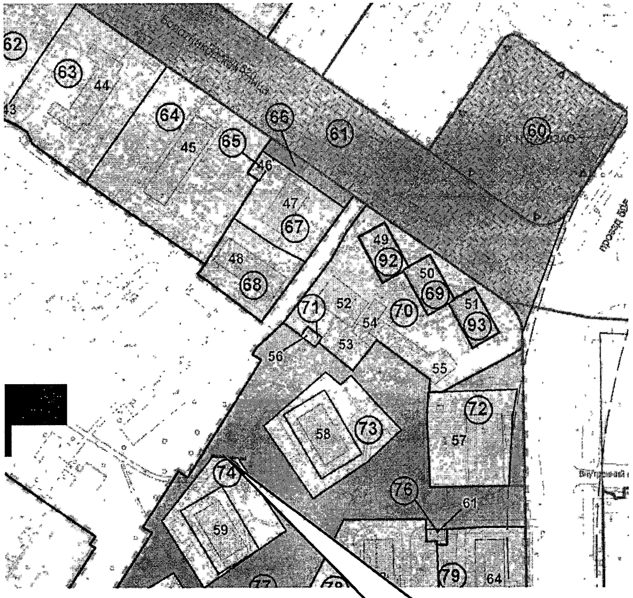
Место установки шлагбаума