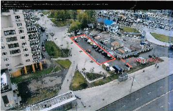
ПЛАН ФУНКЦИОНАЛЬНОГО ЗОНИРОВАНИЯ НА 2024 ГОД Общественное обсуждение проекта по адресу: Москва, ул. Азовская, д. 24, кв. 24 территории места Проект работы: пятница, суббота, воскресенье