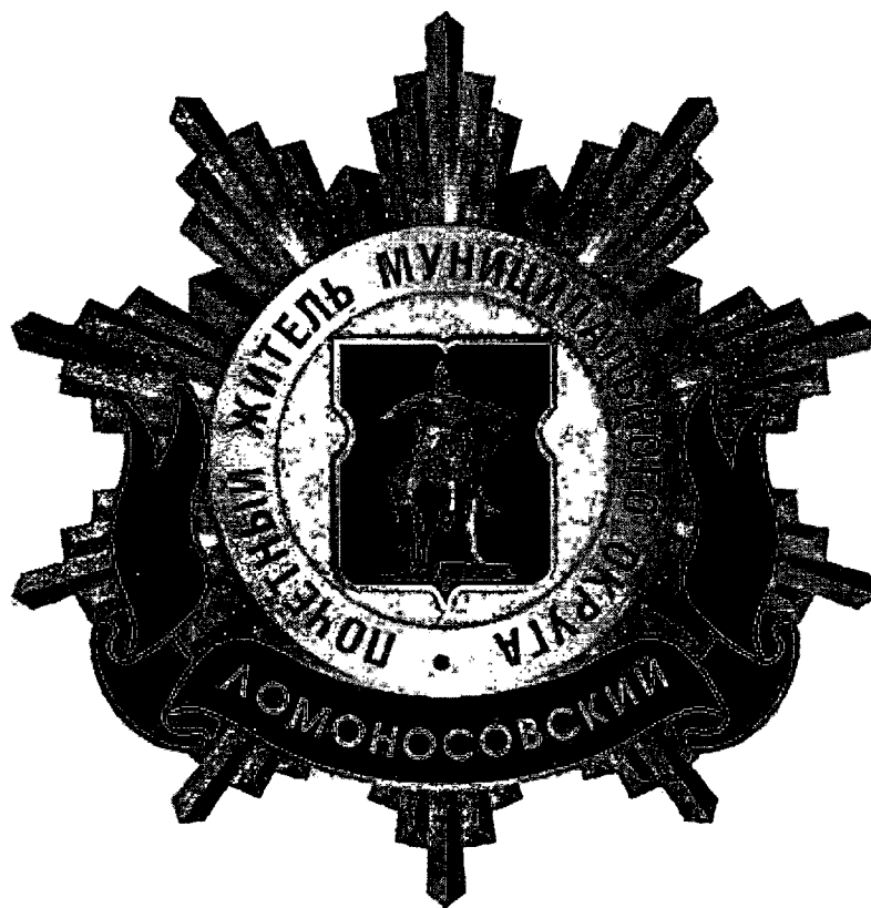
Рисунок нагрудного знака к званию «Почетный житель внутригородского муниципального образования – муниципального округа Ломоносовский в городе Москве»

Приложение 3 к решению Совета депутатов внутригородского муниципального образования – муниципального округа Ломоносовский в городе Москве от 18 февраля 2025 года № 47/5