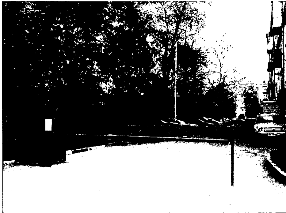
Рис. 2. Внешний вид шлагбаума.

Стрела для проездов до 4 000 мм: горизонтальные связи – 40 x 40 x 2, вертикальные – 40 x 40 x 1.5. Порошковая окраска, стандартный цвет - оранжевый. Оцинкованная зубчатая рейка (пр-во Италия) в комплекте.