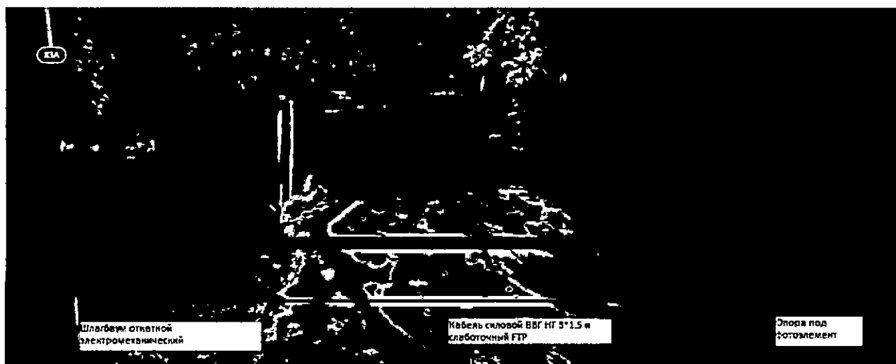
Рис. 1 Схема размещения шлагбаума