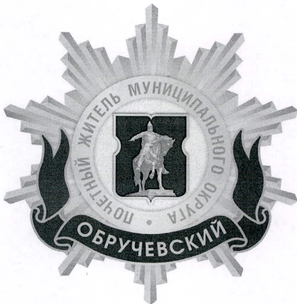
Рисунок нагрудного знака к званию «Почетный житель внутригородского муниципального образования – муниципального округа Обручевский в городе Москве»

Приложение 3 к решению Совета депутатов внутригородского муниципального образования – муниципального округа Обручевский в городе Москве от 18 февраля 2025 года № 34/5